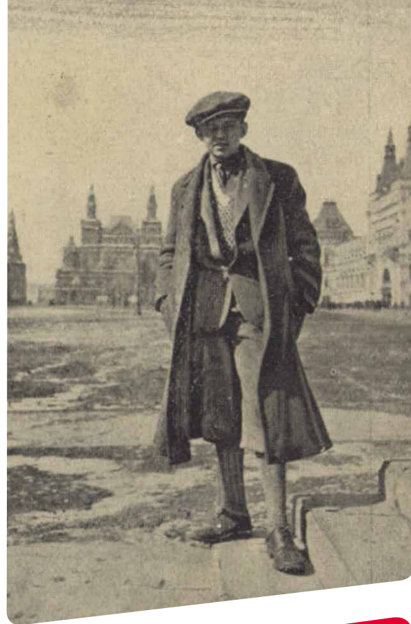
Imatge extreta del llibre Le tour du monde en 44 jours de Palle Huld, un jove boy-scout danès en qui Hergé es va inspirar per al personatge de Tintín.